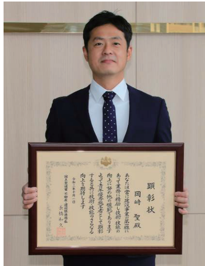
岡崎 聖 殿