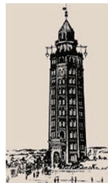
凌雲閣（りょううんかく）

日本エレベーター協会では、この11月10日を「エレベーターの日」と定め、昇降機の安全、安心な利用のためのキャンペーンを実施しています。