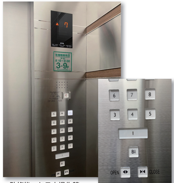
改修後 かご内操作盤 全面点灯式で視認性、操作性の優れたボタンへ改修 ドアに合せた横目のヘアラインは特注 操作盤の鏡面エッチングラインは、側面壁目地と連続性を持たせています