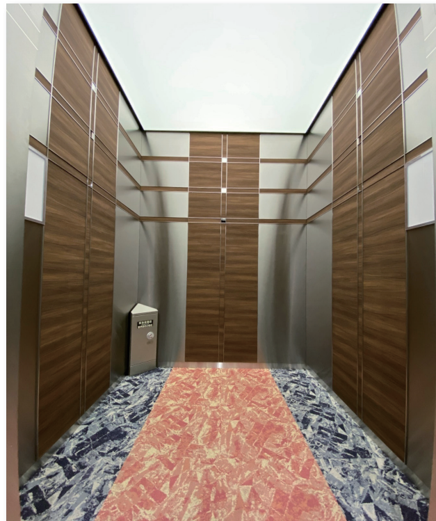
改修後 かが室 (背面側) 全面光膜天井にステンレスと木を基調としたシンプルで上品な意匠