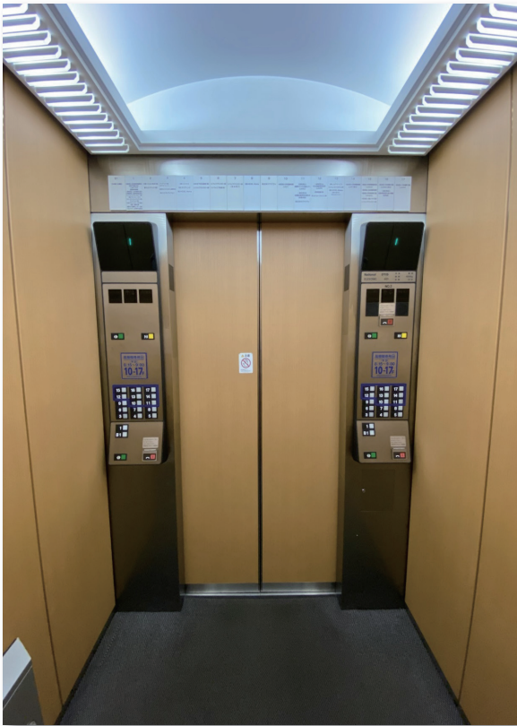
改修前 かが室 (出入口側)