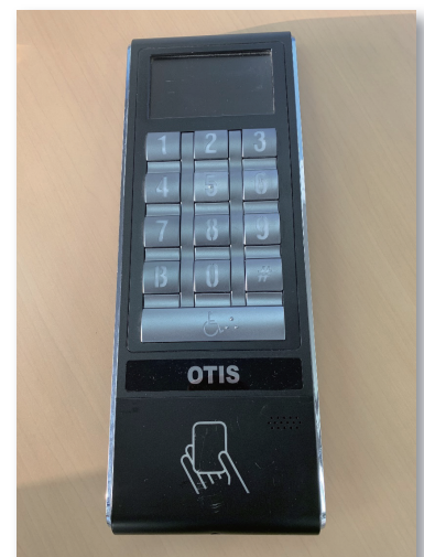
改修後 行先階先行予約登録システム操作盤