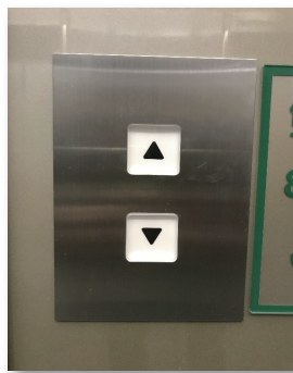
改修後 乗場ボタン 全面点灯式で視認性、操作性の優れたボタンへ改修