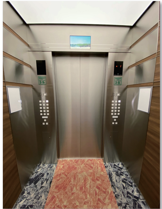
改修後 かが室 (出入口側)