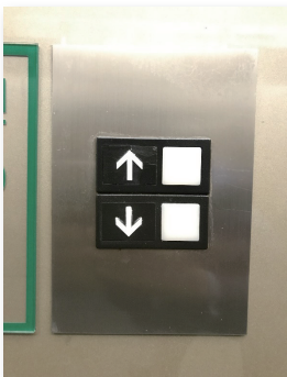
改修前 乗場ボタン