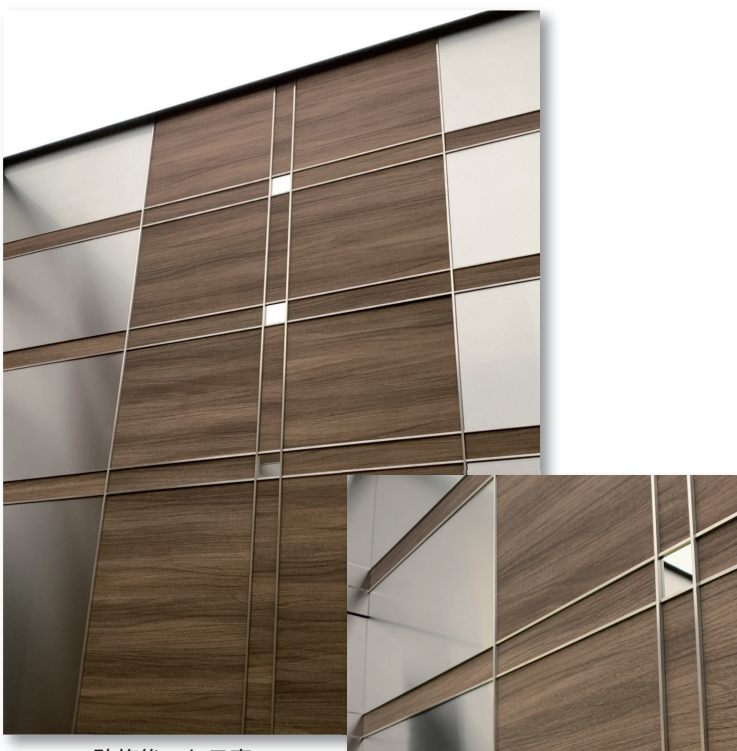
改修後 かご室 上品な鏡面アクセントはさりげなく凝ったディテール