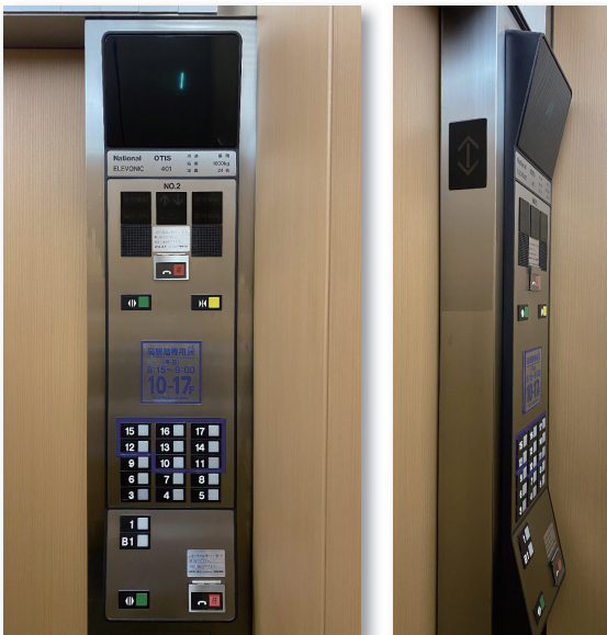
改修前 かご内操作盤