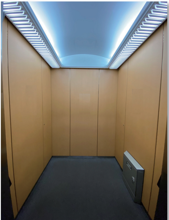
改修前 かが室 (背面側) 間接照明+ドーム天井の既存意匠