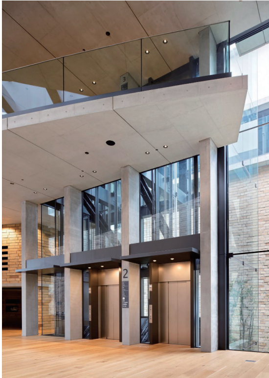
EV1a、EV2b号機 2階エレベーターホール