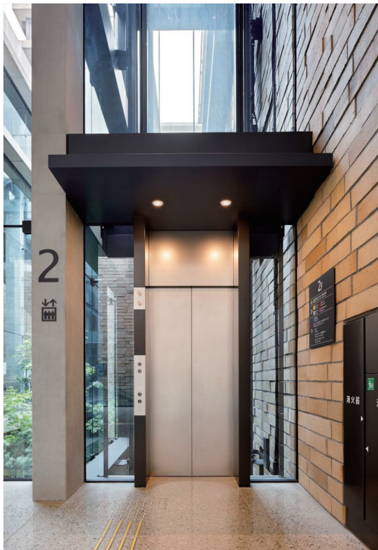
EV2号機 2階エレベーターホール