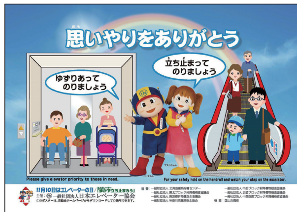
全国統一ポスター、ステッカーのデザイン